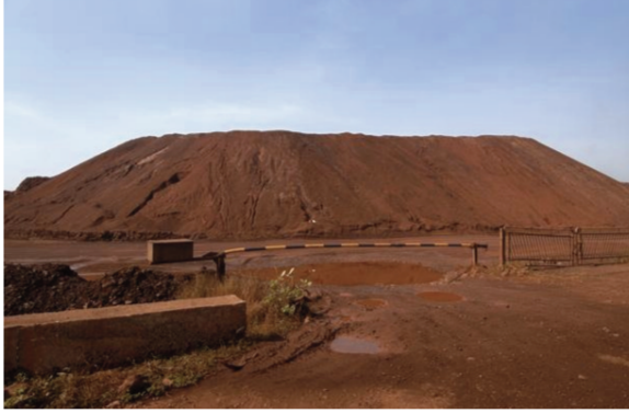
समोर आलेला नाही. याव्यतिरिक्त, गोवा फाऊंडेशनने अधिकाऱ्यांवर बेकायदेशीरपणे हे खाण डंप तयार करणाऱ्या भाडेपट्टेदारविरुद्ध, त्यांच्या सह-षड्यंत्रकर्त्यांसह (जमीन मालक आणि सरकारी अधिकारी) ज्यामध्ये गोवा सरकारने पुढे जाण्यापूर्वी पूर्ण केल्या पाहिजेत. तथापि, त्यांनी असे प्रतिपादन केले की या अटी पूर्ण झाल्याचा कोणताही पुरावा अद्याप

पणजी, दि. ३० : गोवा फाऊंडेशनने आज नियोजित असणाऱ्या (३१ जानेवारी) खनिज डंपच्या लिलावाला तीव्र आक्षेप घेतला आहे. याबाबत फाऊंडेशनने भूगर्भ संचालकांना लिहिलेल्या पत्रात असा इशारा दिला आहे की, अशा खाणकामांना पूर्वी भाडेपट्ट्याशिवाय परवानगी देणे हे विद्यमान कायदानुसार बेकायदेशीर असेल. खाण आणि भूगर्भ संचालकांना लिहिलेल्या पत्रात, फाऊंडेशनच्या पर्यावरण निरीक्षकांनी निदर्शनास आणून दिले आहे की, खाण आणि खनिजे (विकास आणि नियमन) कायदा, १९५७ (एमएमडीआर कायदा) मध्ये कलम ४ मध्ये स्पष्टपणे म्हटले आहे की खाणकाम केवळ वैध खनिज भाडेपट्ट्याअंतर्गतच केले जाऊ शकते. याबाबत फाऊंडेशनने भारत कोइंग कोळसा लिमिटेड प्रकरणात १९९० च्या सर्वोच्च न्यायालयाच्या निर्णयाचा संदर्भ दिला आहे. ज्याने या कायदेशीर आवश्यकता अधोरेखित केल्या आहेत. फाऊंडेशनने हे देखील अधोरेखित केले की सर्वोच्च न्यायालयाच्या १३ डिसेंबर २०२२ च्या आदेशाने खनिज डंप उत्खनन करण्याची परवानगी दिली होती, परंतु विशिष्ट अटी लादल्या होत्या ज्या गोवा सरकारने पुढे जाण्यापूर्वी पूर्ण केल्या पाहिजेत. तथापि, त्यांनी असे प्रतिपादन केले की या अटी पूर्ण झाल्याचा कोणताही पुरावा अद्याप