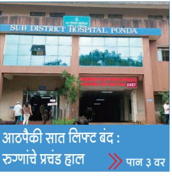
आठपैकी सात लिफ्ट बंद : रुग्णांचे प्रचंड हाल