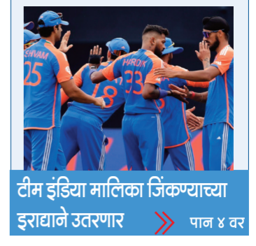
टीम इंडिया मालिका जिंकण्याच्या झुराघाते उतरणार